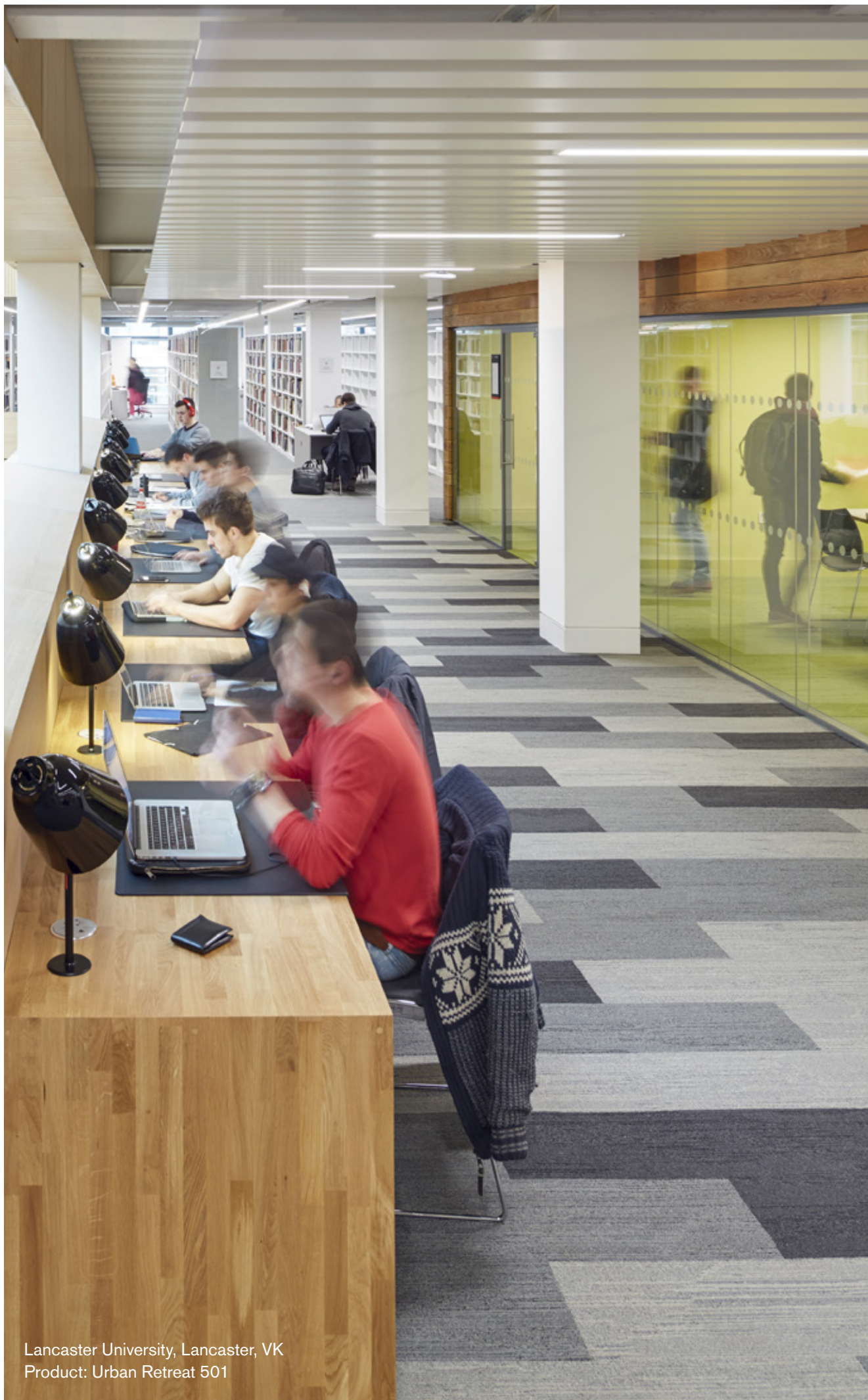
Lancaster University, Lancaster, VK Product: Urban Retreat 501