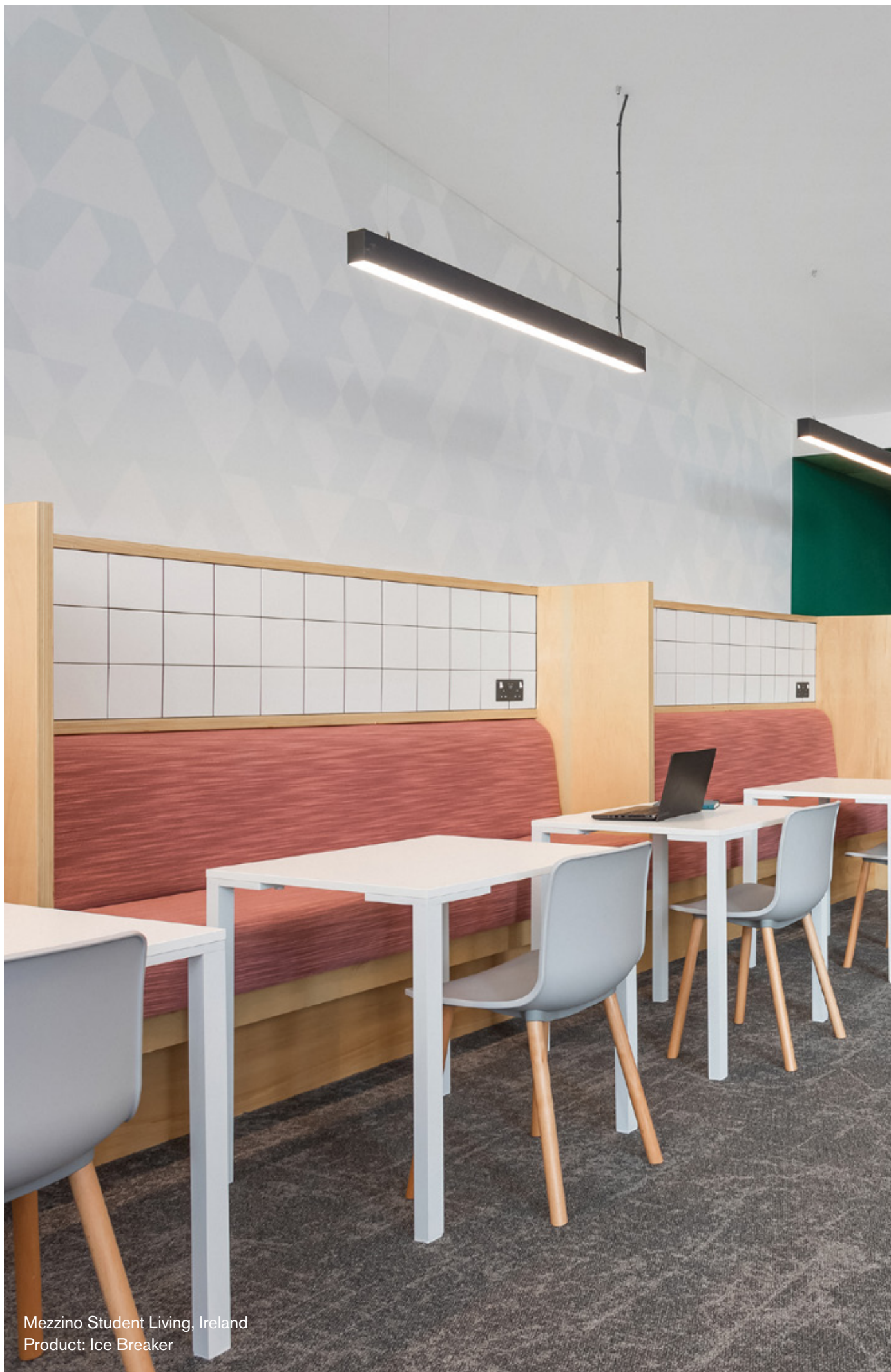
Mezzino Student Living, Ireland Product: Ice Breaker