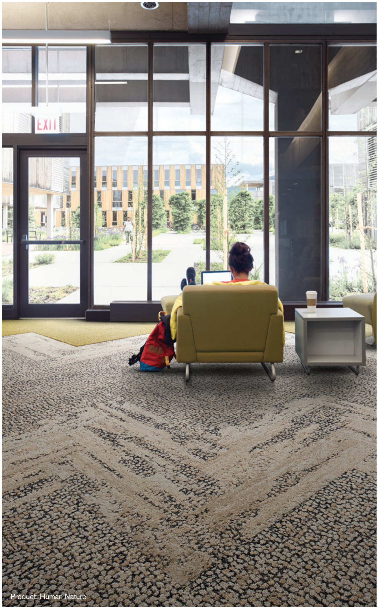
Product: Human Nature