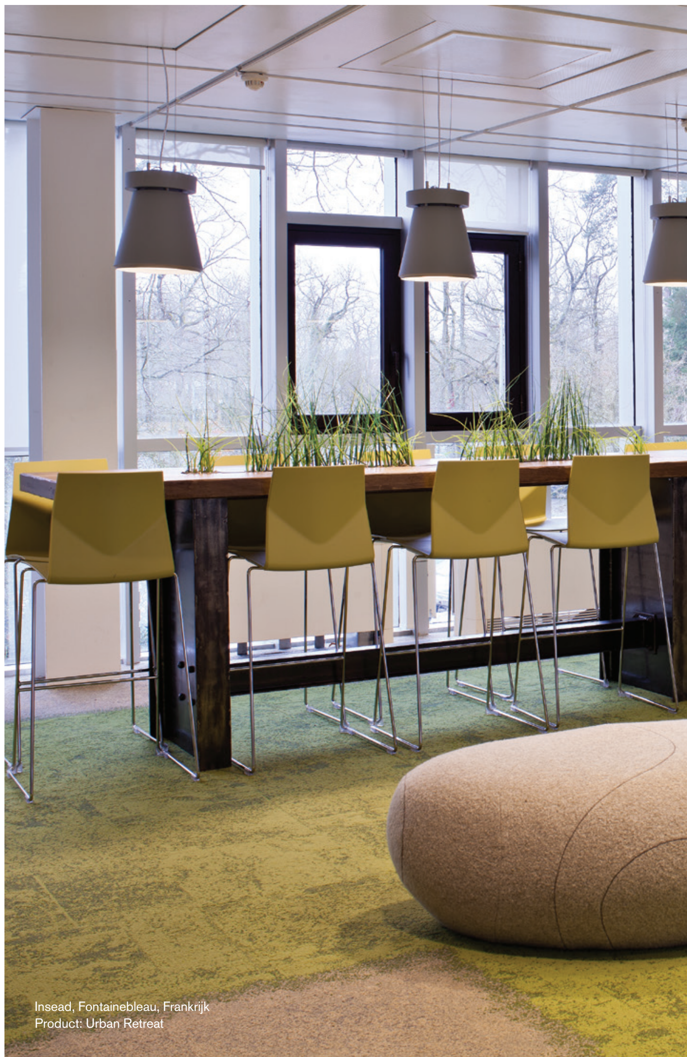
Insead, Fontainebleau, Frankrijk Product: Urban Retreat