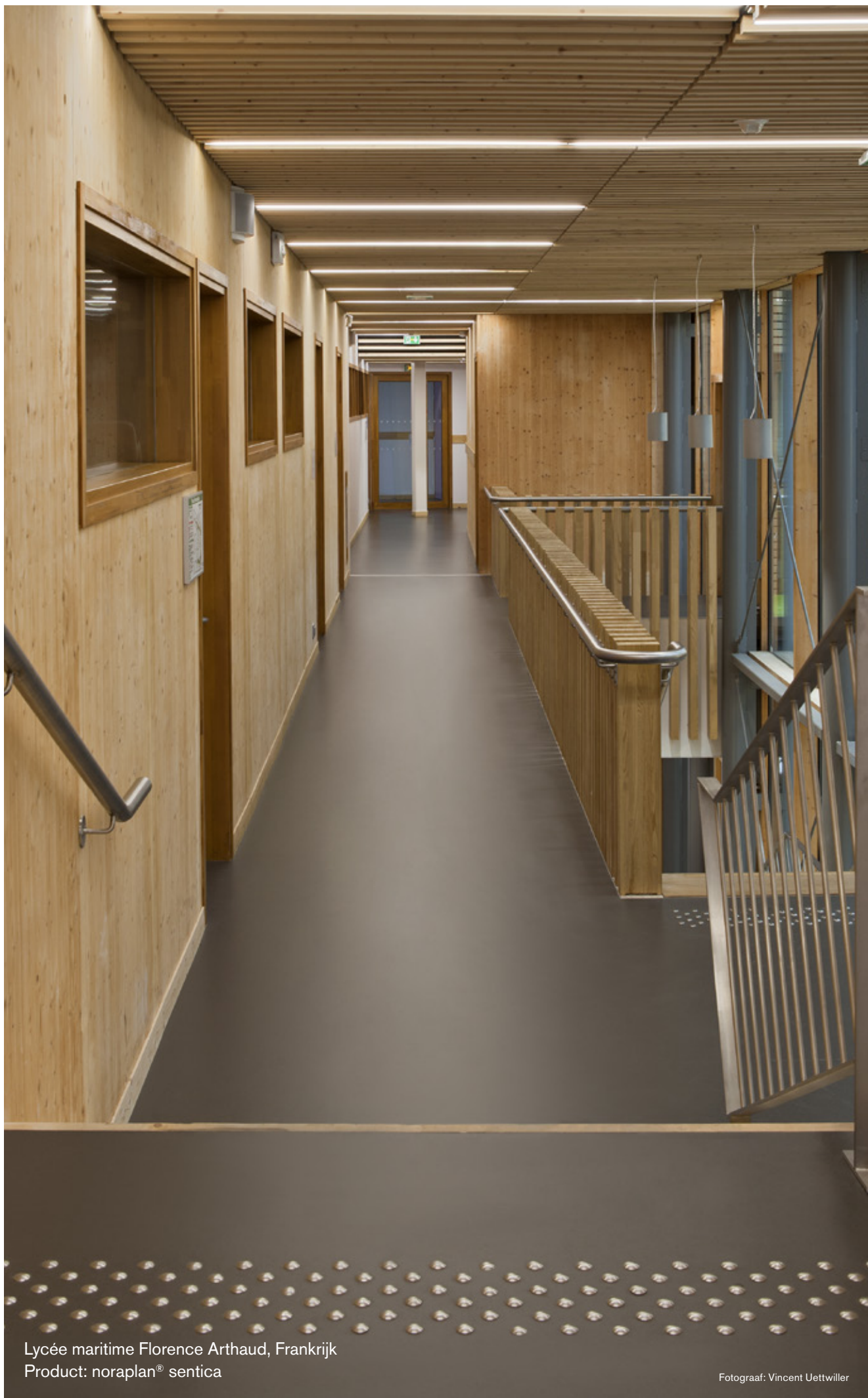
Lycée maritime Florence Arthaud, Frankrijk Product: noraplan® sentica