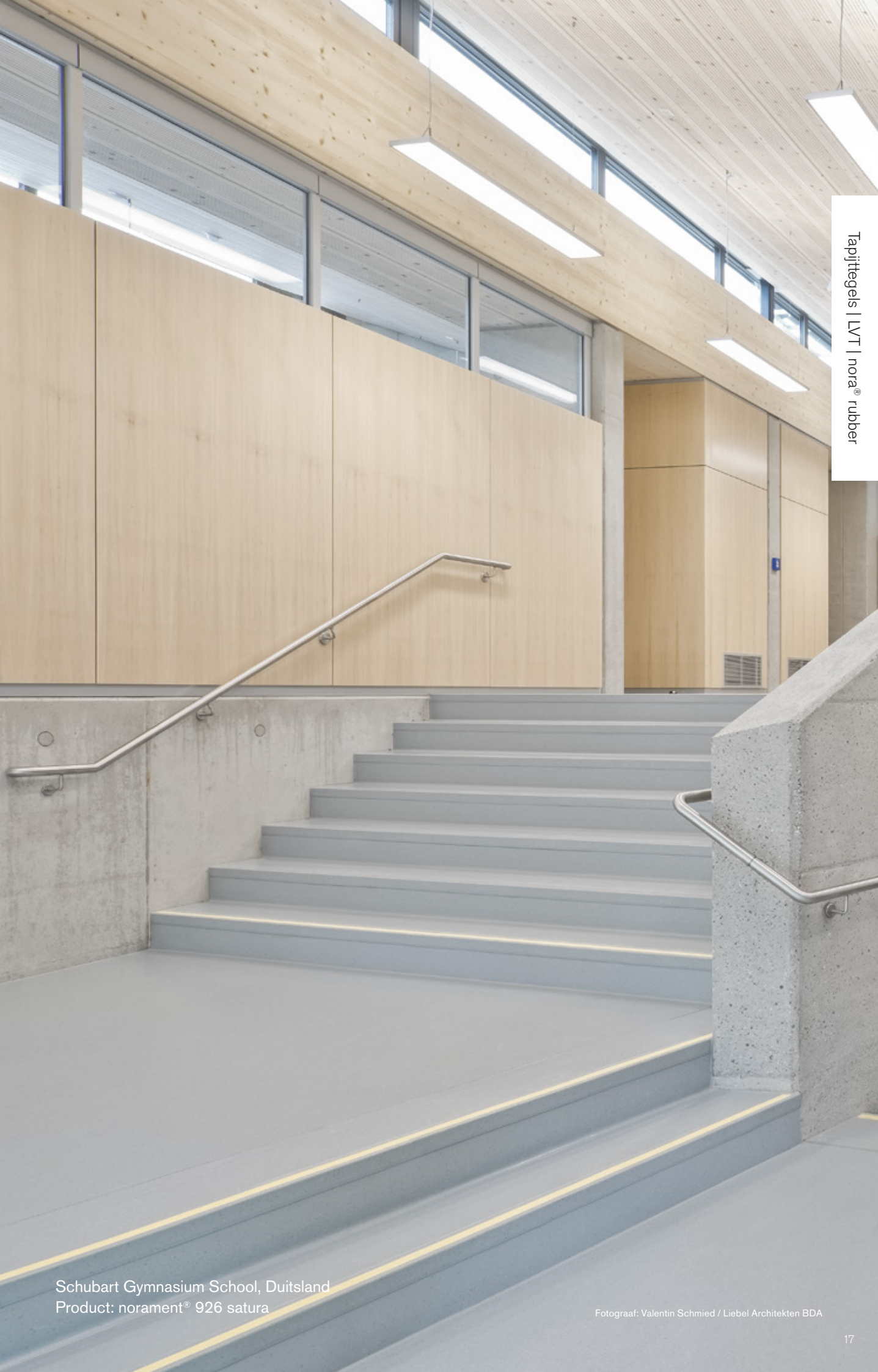
Schubart Gymnasium School, Duitsland Product: norament® 926 satura