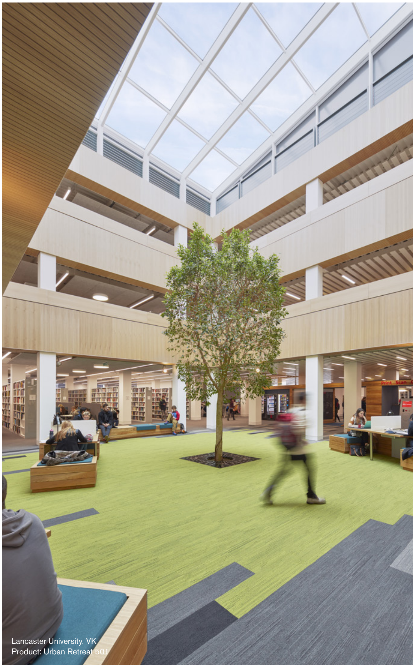
Lancaster University, VK Product: Urban Retreat 501