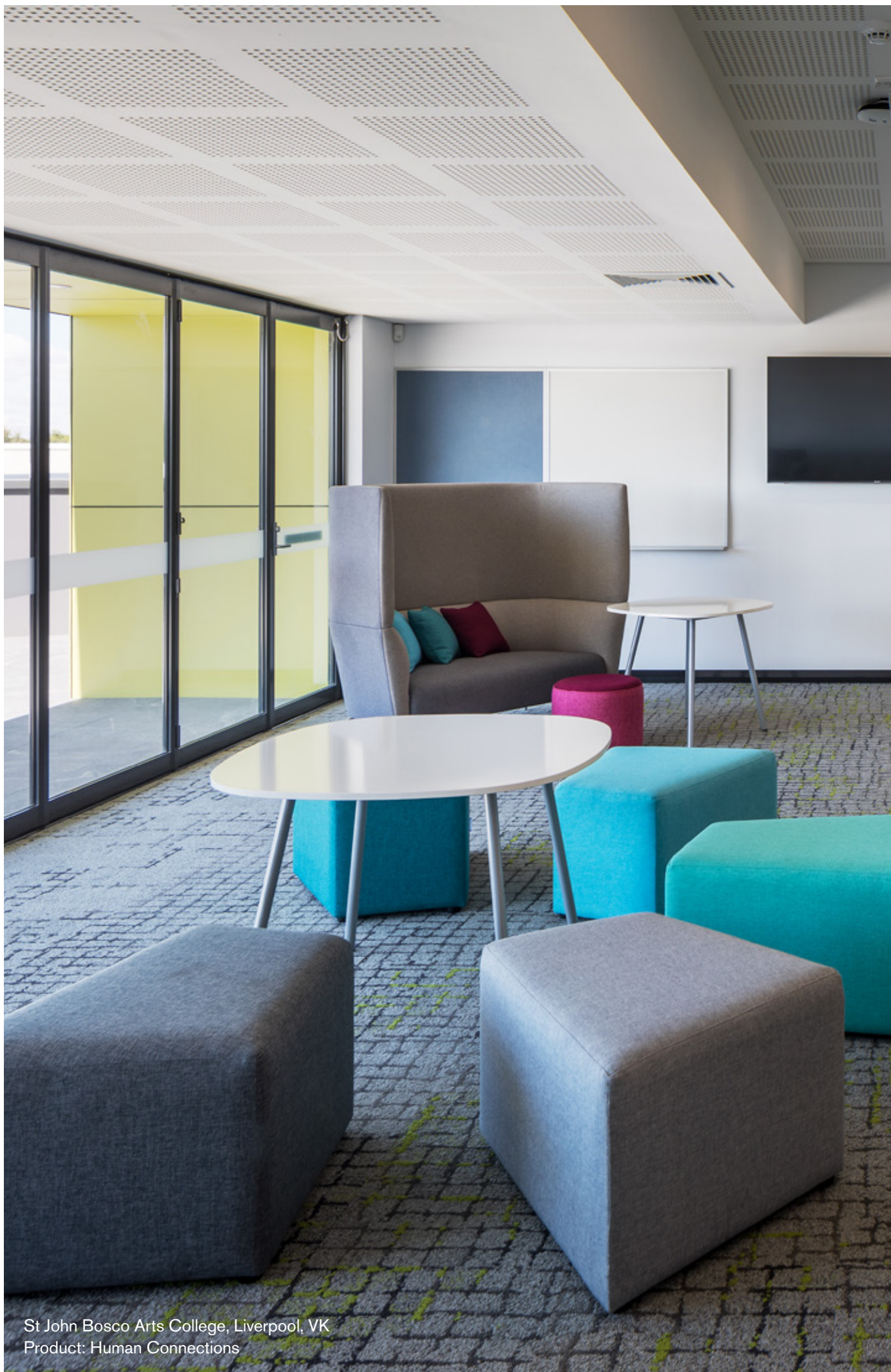
St John Bosco Arts College, Liverpool, VK Product: Human Connections