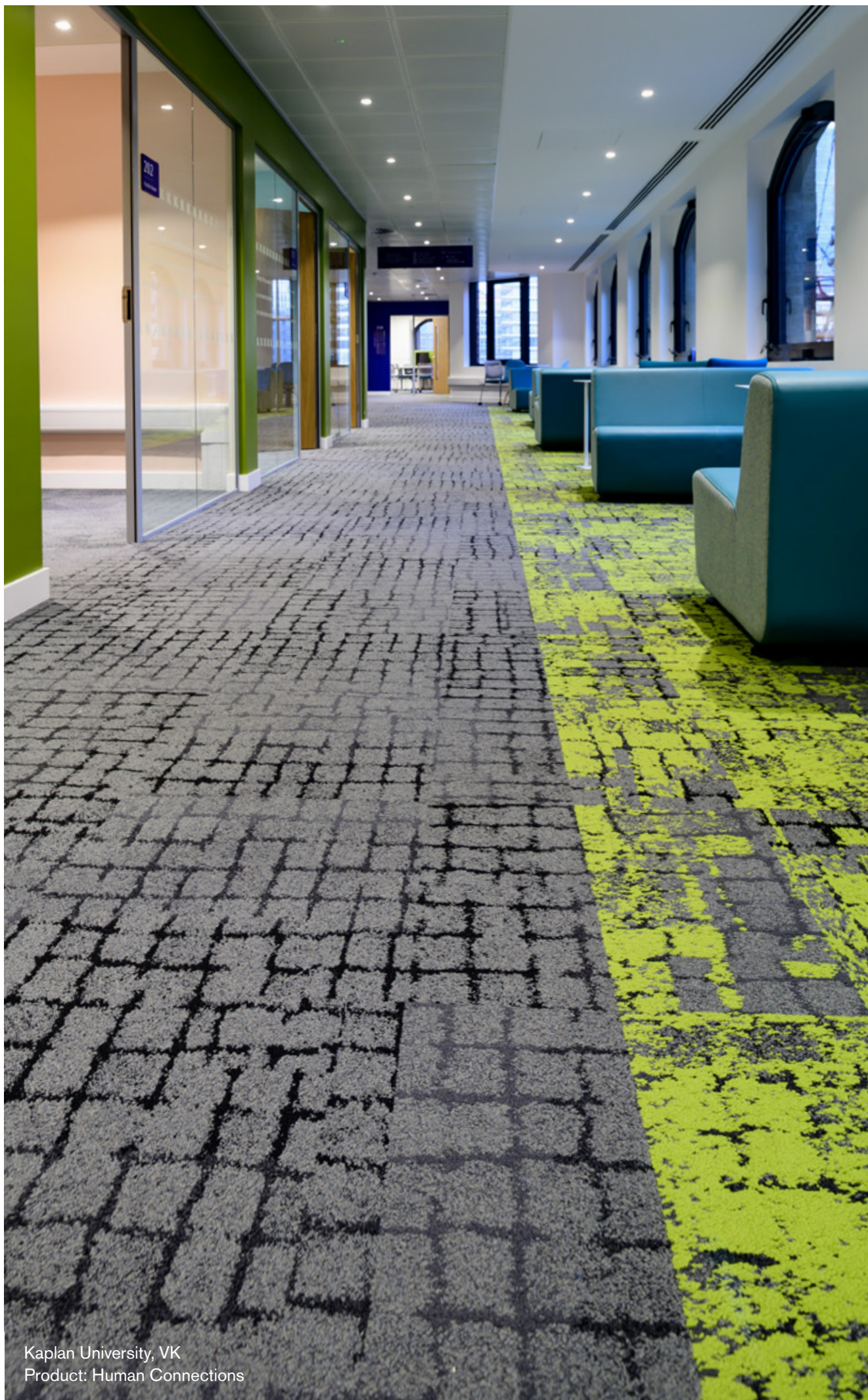
Kaplan University, VK Product: Human Connections