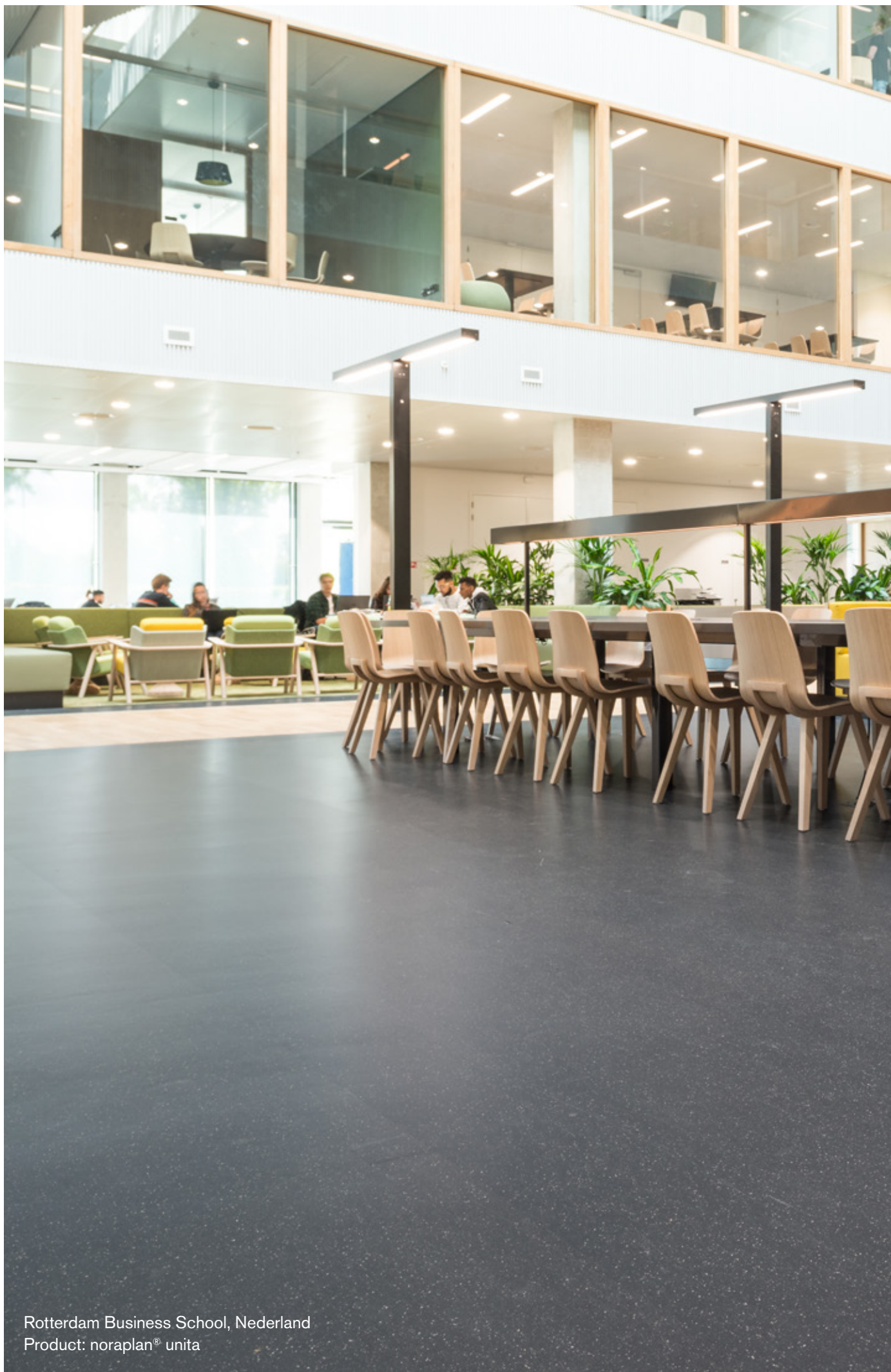
Rotterdam Business School, Nederland Product: noraplan® unita