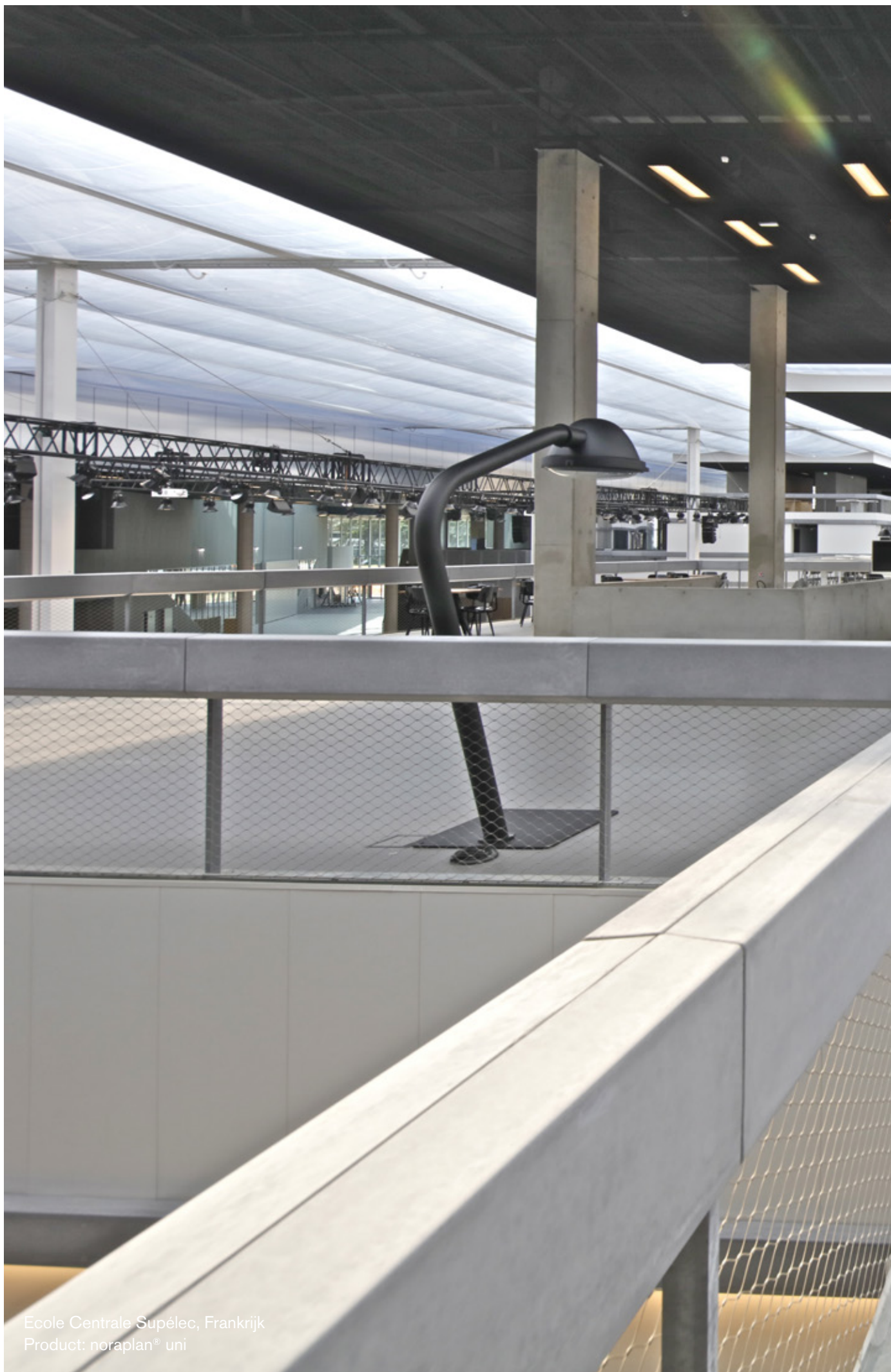
Ecole Centrale Supélec, Frankrijk Product: noraplan® uni