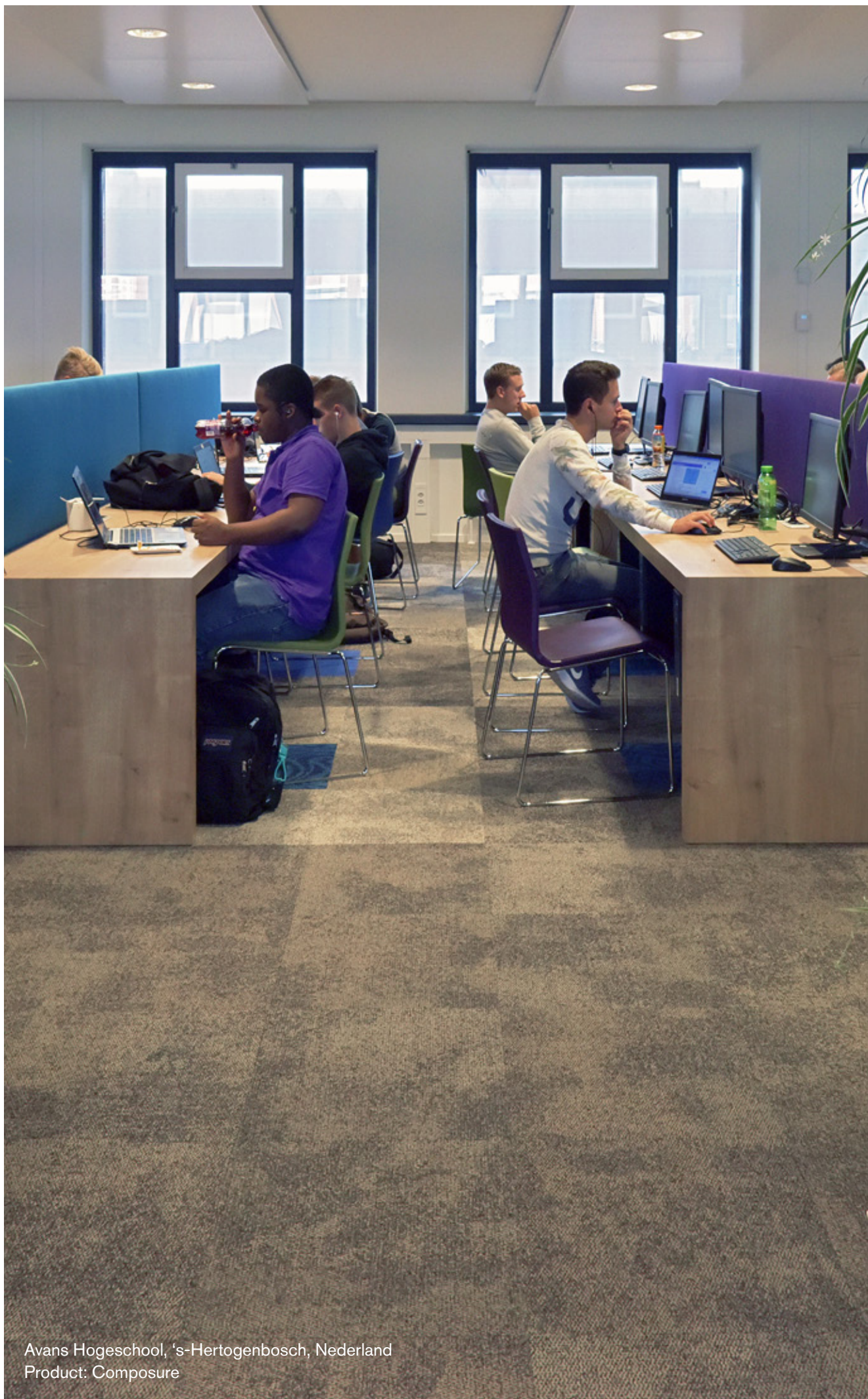
Avans Hogeschool, 's-Hertogenbosch, Nederland Product: Composure