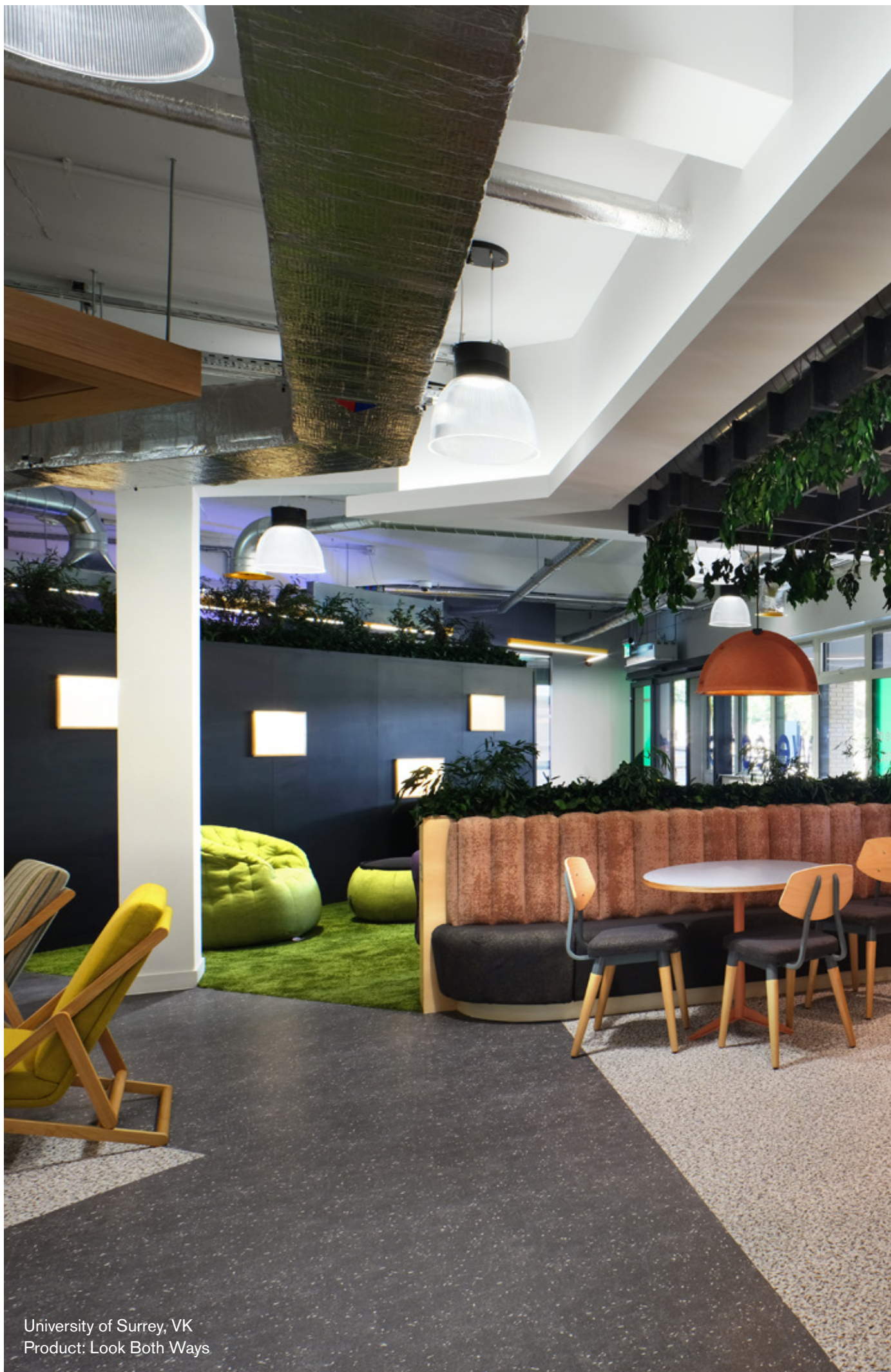
University of Surrey, VK Product: Look Both Ways