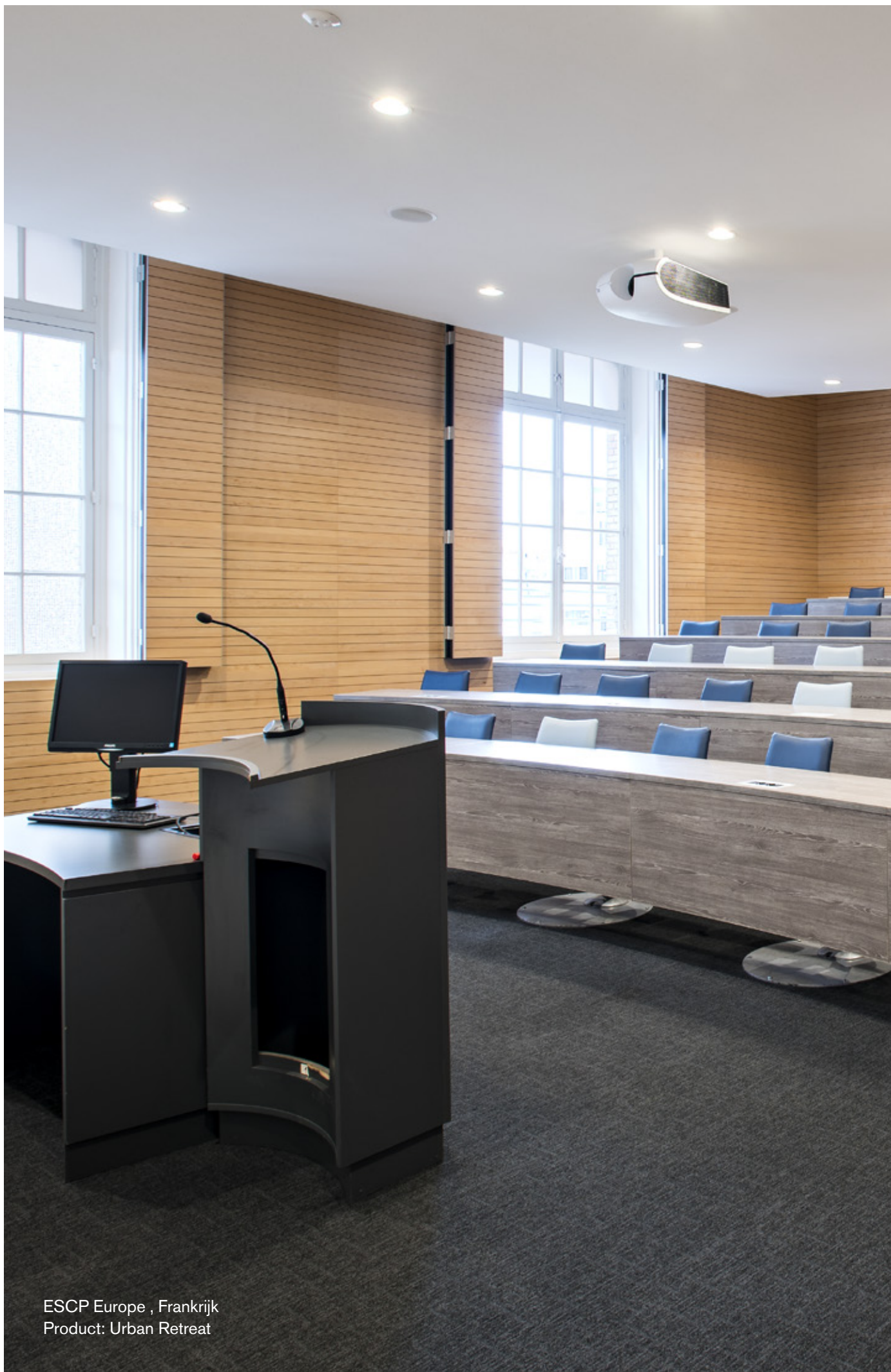
ESCP Europe , Frankrijk Product: Urban Retreat