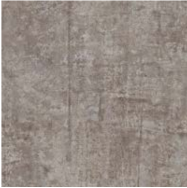
TEXTURED STONES A00304 EMPERADOR GRAY