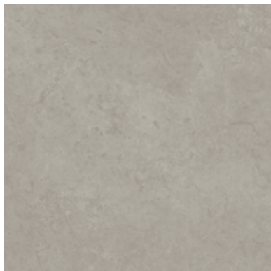
TEXTURED STONES A00308 LIGHT CONCRETE