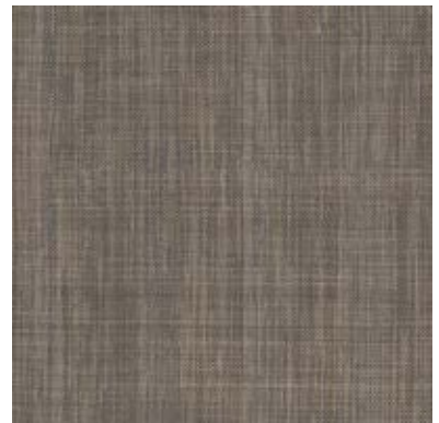
TEXTURED STONES A00307 CHESTNUT HORSEHAIR