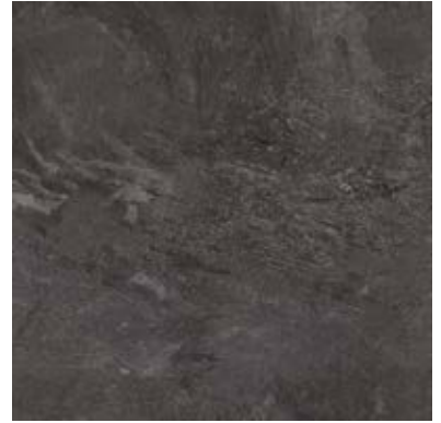
NATURAL STONES A00101 JET MIST