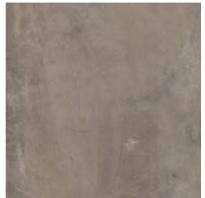
TEXTURED STONES A00303 WARM POLISHED CEMENT