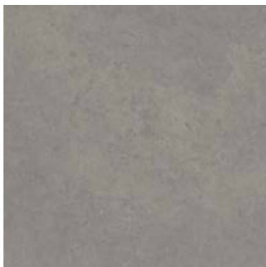
TEXTURED STONES A00309 MEDIUM CONCRETE