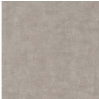
TEXTURED STONES A00311 DISTRESSED CONCRETE