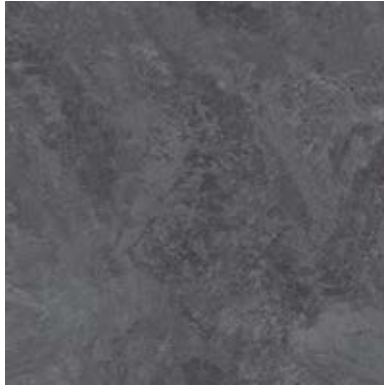
NATURAL STONES A00103 COOL IMPALA MARBLE