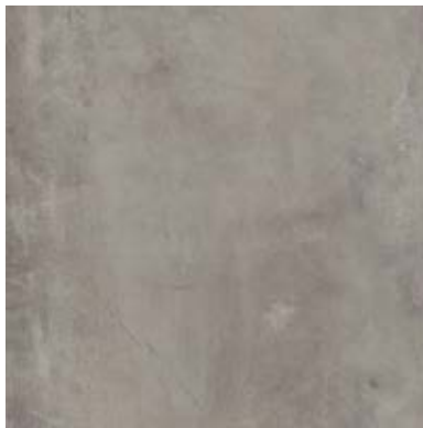
TEXTURED STONES A00302 COOL POLISHED CEMENT