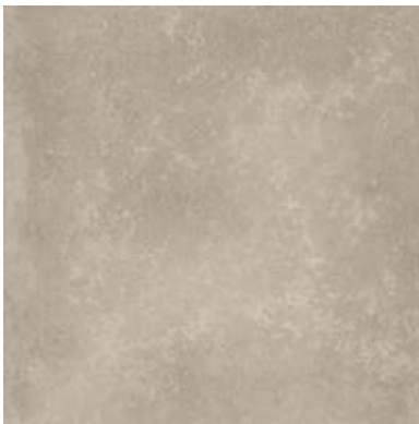
TEXTURED STONES A00301 POLISHED CEMENT