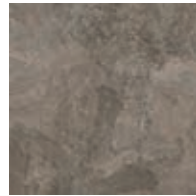
A00104 WARM IMPALA MARBLE