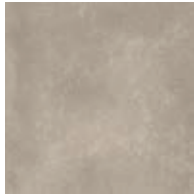
A00301 POLISHED CEMENT