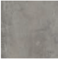
A00302 COOL POLISHED CEMENT