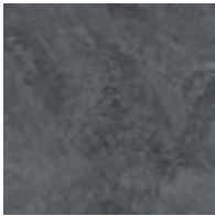
A00103 COOL IMPALA MARBLE