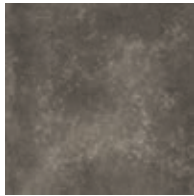
A00102 MARONE DARK MARBLE