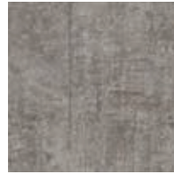
A00304 EMPERADOR GRAY