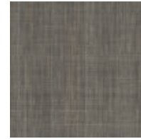
A00307 CHESTNUT HORSE HAIR