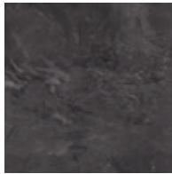
A00101 JET MIST