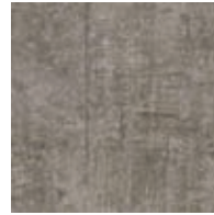
A00305 EMPERADOR TAUPE