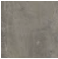
A00303 WARM POLISHED CEMENT