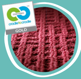
Ausgewählte Farben unserer Kollektion Monochrome