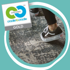
Unsere Teppichfliesen- Kollektion Conscient

Interface wurde mit dem „Cradle to Cradle Certified™ (C2C) Gold“-Zertifikat ausgezeichnet für: